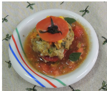
トマトの肉詰め・焼き